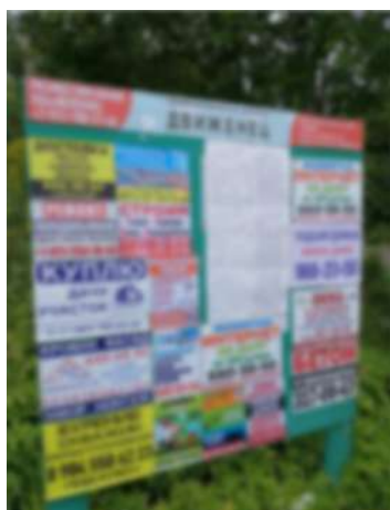
Фото наших стендов

Работники правления регулярно срывают такие объявления. Вашу рекламу в неразрешенном месте увидят мало людей. Плюс вы настроите против своей компании администрацию дачного кооператива и многих садоводов - любителей.